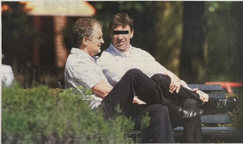
Willem Holleeder (rechts) en de in 2004 geliquideerde vastgoedhandelaar Willem Endstra.