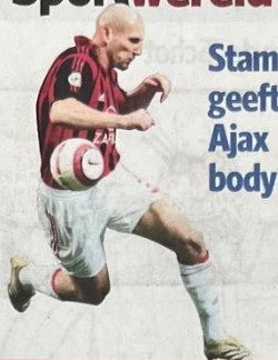
Stam geeft Ajax body