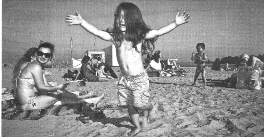
Zomerse tafereel tijdens de laatste dagen van september op Blijburg.